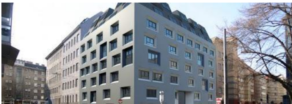
A Hagenmüllergasse 2015-ben felújított épülete építészeti díjat nyert 2016-ban és 17-ben

A szállásokon közösségépítő programok vannak, amelyekről a saját maguk által készített hírlevélben olvashatnak a lakók. A közösségi kirándulások (mozi, múzeum, bowling) mellett sütés-főzés tanfolyamok, társasjáték estek, különböző témájú előadások, kreatív foglalkozások, kiscsoportos workshopok (számítástechnikai ismeretek, dohányzásról való leszokás), kertészkedés, bolhapiac, kutyasétáltatás, kertészkedés várja az érdeklődőket. Bár a pandémia ideje alatt a programokat korlátozni kényszerültek, egyéni foglalkozásokon keresztül igyekeztek csökkenteni az izolációval járó stresszt, és támogatni a kapcsolatok fennmaradását.