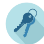
Core principles of Housing First