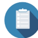
Measuring outcomes in HF