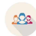
Delivering Support in HF