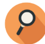
What is Housing First?