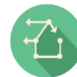
HF and Wider Strategy