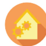
Delivering Housing in HF