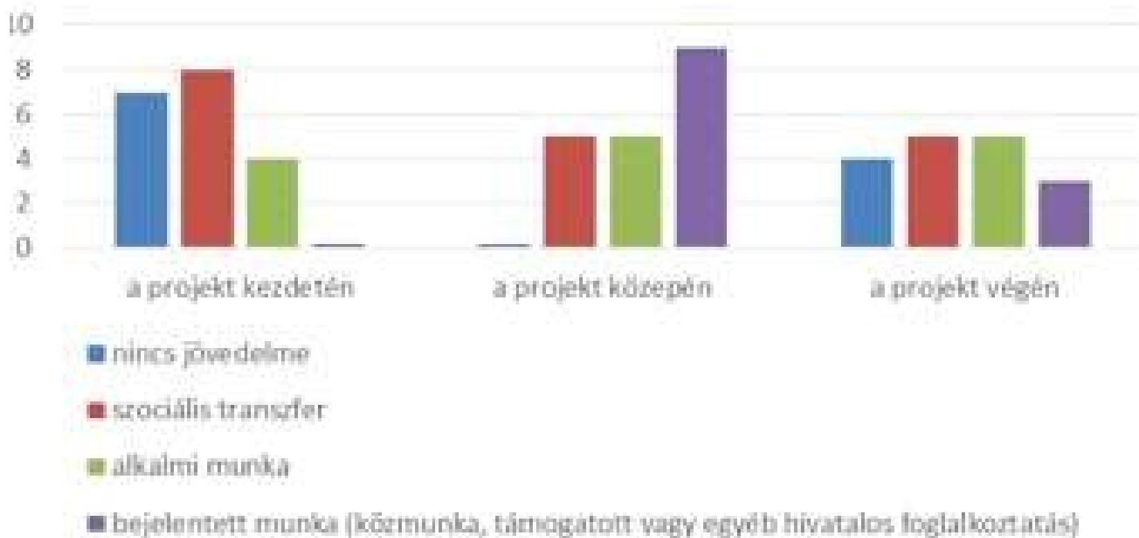
A résztvevők jövedelforrásainak alakulása